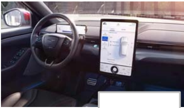
Ford SYNC 4A