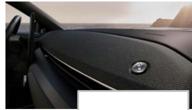
B&O zvočni sistem