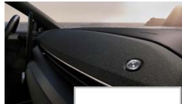
B&O zvočni sistem