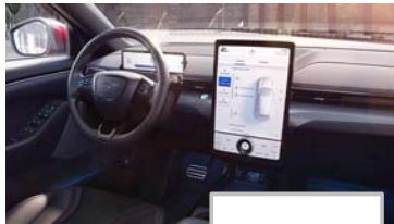
Ford SYNC 4A