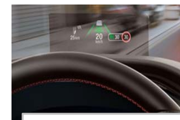
Projekcijski zaslon Head up