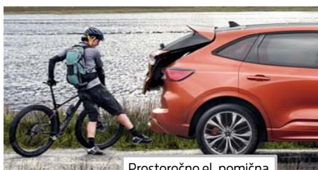
Prostoročno el. pomična prtljažna vrata