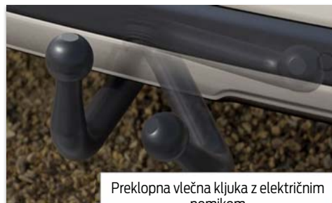
Preklopna vlečna kljuka z električnim pomikom