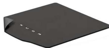
Obojestranski tepih za prtljažni prostor