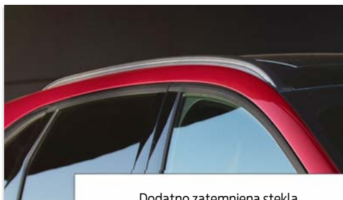
Dodatno zatemnjena stekla