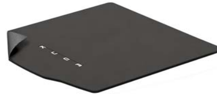
Obojestranski tepih za prtljažni prostor