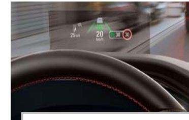
Projekcijski zaslon Head up