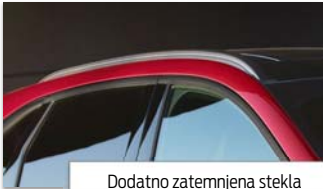
Dodatno zatemnjena stekla