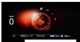
Izbira voznega načina

*samo že naročena vozila oz. vozila iz zaloge