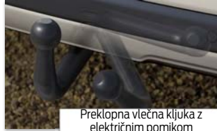
Preklopna vlečna kljuka z električnim pomikom