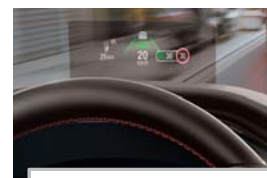
Projekcijski zaslon Head up