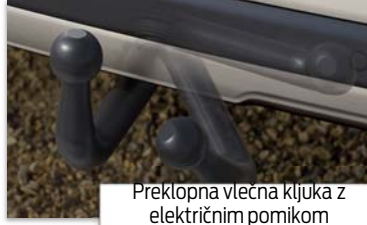
Preklopna vlečna kljuka z električnim pomikom