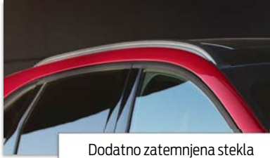
Dodatno zatemnjena stekla