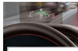
Projekcijski zaslon Head up