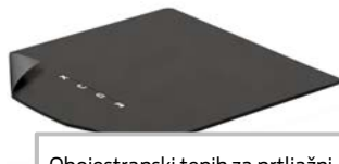
Obojestranski tepih za prtljažni prostor