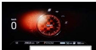
Izbira voznega načina