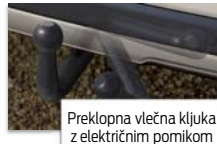
Preklopna vlečna kljuka z električnim pomikom