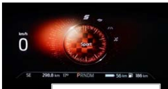
Izbira voznega načina