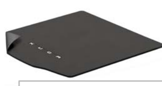
Obojestranski tepih za prtljažni prostor