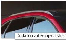
Dodatno zatemnjena stekla