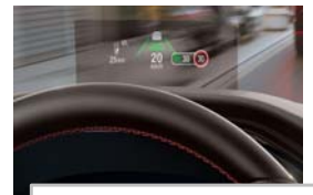
Projekcijski zaslon Head up