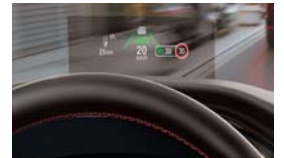
Projekcijski zaslon Head up