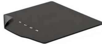
Obojestranski tepih za prtljažni prostor