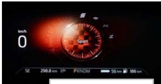
Izbira voznega načina