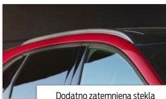
Dodatno zatemnjena stekla