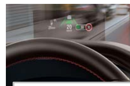
Projekcijski zaslon Head up