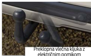
Preklopna vlečna kljuka z električnim pomikom