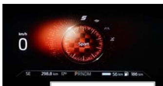
Izbira voznega načina