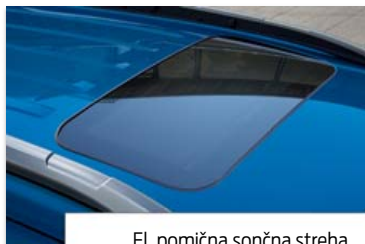
El. pomična sončna streha

Opomba: v primeru, da je streha v kontrastni barvi, je v kontrastni barvi tudi ohišje zunanjih vzvratnih ogledal