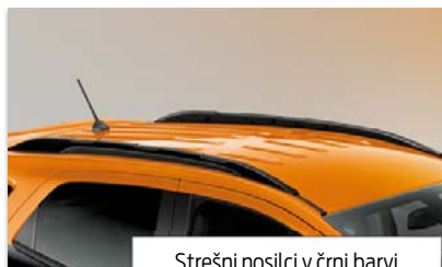
Strešni nosilci v črni barvi