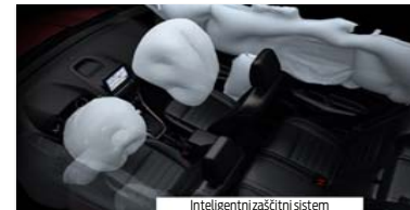
Inteligentni zaščitni sistem

Revolucionarni novi 1,0-litrski 3-valjni bencinski motor EcoBoost vam zagotavlja moč, ki bi jo sicer pričakovali od običajnega 1,6-litrskega motorja, pri tem pa dosega za 24 % manjšo porabo in za 25 % nižje izpuste CO2. Diamantu podobna prevleka na batnih obročkih zmanjšuje trenje; turbopolnilnik, neposredni vbrizg in spremenljiva časovna uskladitev ventilov pa izboljšujejo izkoristek. Rezultat je izjemno varčen motor, ki je že šest let zapored zmagovalec mednarodnih tekmovanj.