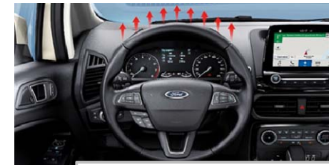
Ogrevan volanski obroč