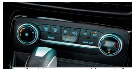
Klimatska naprava s samodejno regulacijo temperature