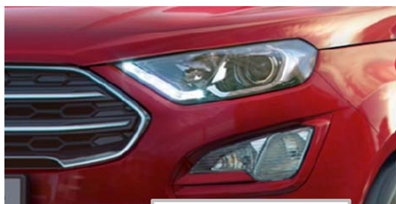
LED dnevne luči