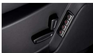
Električno nastavljeni sedeži s spominsko funkcijo