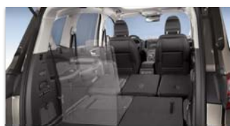
Elektro-mehanskega podiranja sedežev 'Easy Fold Flat'