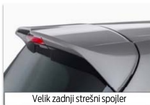
Velik zadnji strešni spojler