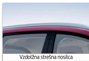
Vzdolžna strešna nosilca