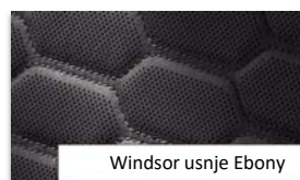
Windsor usnje Ebony