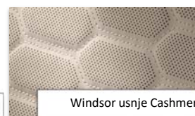
Windsor usnje Cashmere