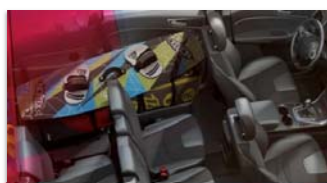
Sedeža v tretji vrsti