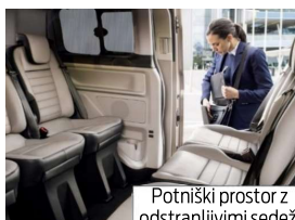
Potniški prostor z odstranljivimi sedeži