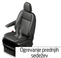
Ogrevanje prednjih sedežev