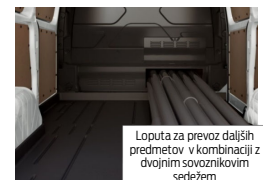
Loputa za prevoz daljših predmetov v kombinaciji z dvojnimi sovoznikovim sedežem (ni na voljo s pogonom mHEV)