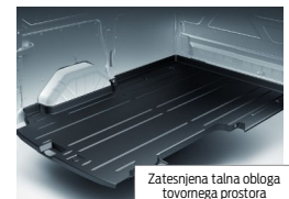
Zatesnjena talna obloga tovnega prostora