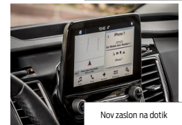
Nov zaslon na dotik