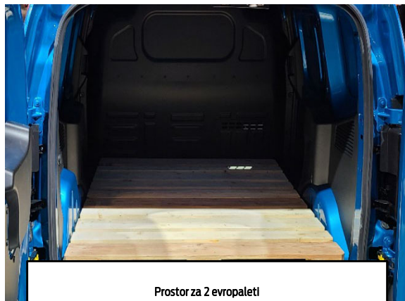
Prostor za 2 evropaleti