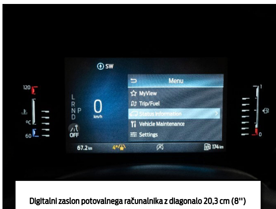
Digitalni zaslon potovalnega računalnika z diagonalo 20,3 cm (8")