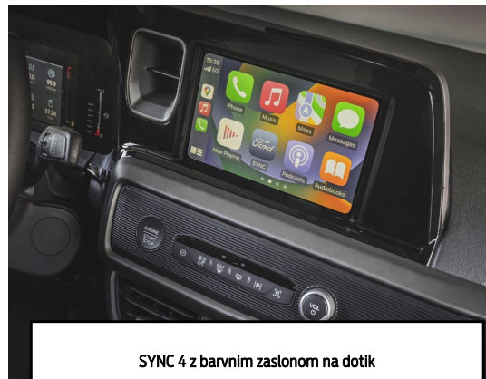
SYNC 4 z barvnim zaslonom na dotik