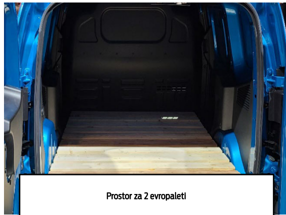
Prostor za 2 evropaleti