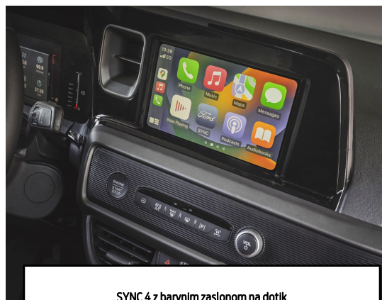
SYNC 4 z barvnim zaslonom na dotik