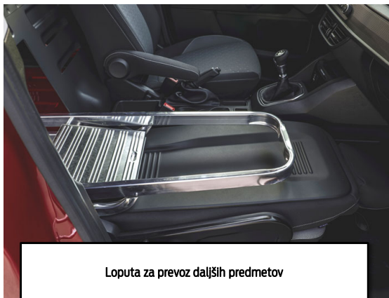
Loputa za prevoz daljših predmetov