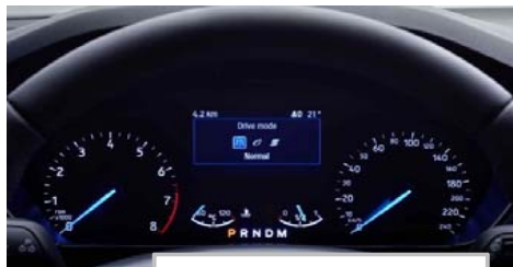
Izbira voznega načina