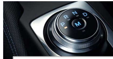
Samodejni 8-stopenjski menjalnik