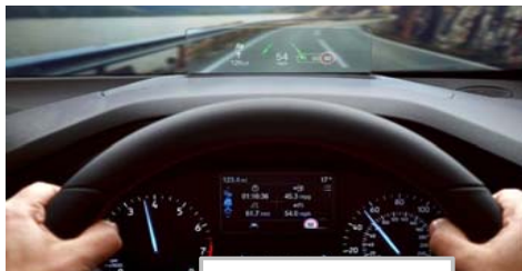
Heads up display