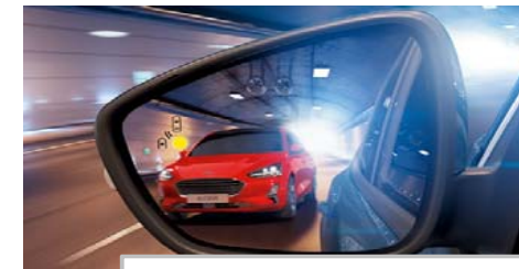
Sistem za zaznavanje mrtvega kota