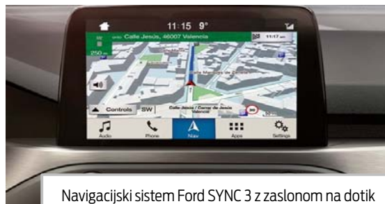
Navigacijski sistem Ford SYNC 3 z zaslonom na dotik