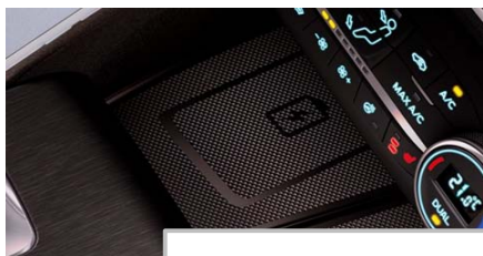
Brezžično polnjenje telefona