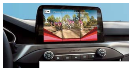
Kamera za pomoč pri vzratni vožnji