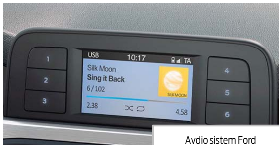
Avdio sistem Ford