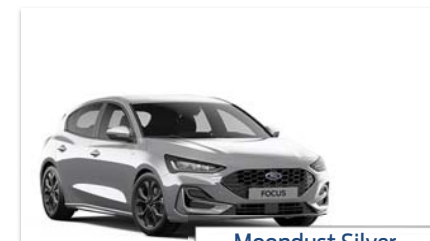
Moon dust Silver