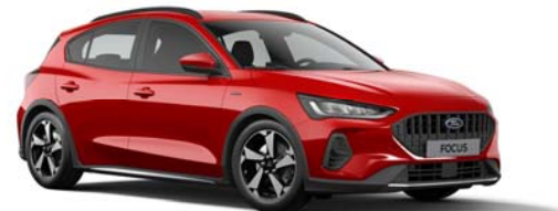
ACTIVE Limited Edition