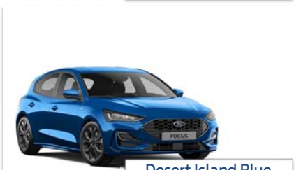
Desert Island Blue