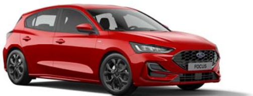
ST-LINE Limited Edition

Pomoč pri vzdrževanju smeri `LKA` Tempomat z omejevalnikom hitrosti Opozorilnik za nepriprave varnostne pasove na zadnjih sedežih Sistem za preprečevanje trčenja z zaznavanjem pešcev in kolesarjev (AEB) ESP z ABS, pomočjo pri speljevanju v klanec `HLA` Zaviranje po trčenju Voznikova in sovoznikova zračna blazina, stranski zračni blazini in zračni zavesi Možnost izklopa sopotnikove zračne blazine Sistem za nadzor tlaka v pnevmatikah