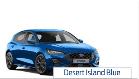
Desert Island Blue