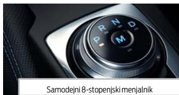
Samodejni 8-stopenjski menjalnik