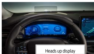
Heads up display