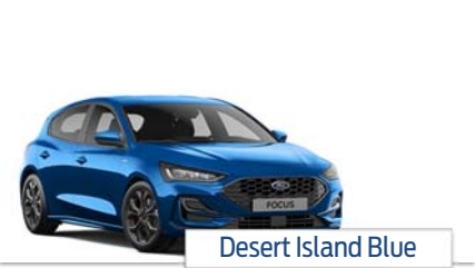
Desert Island Blue