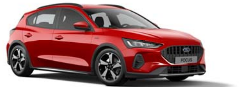
Focus Active Special Edition