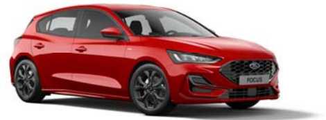
Focus ST-Line Special Edition