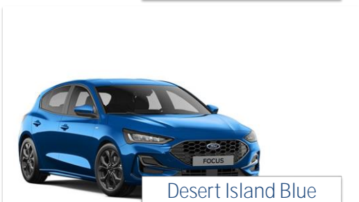
Desert Island Blue