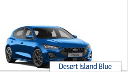
Desert Island Blue