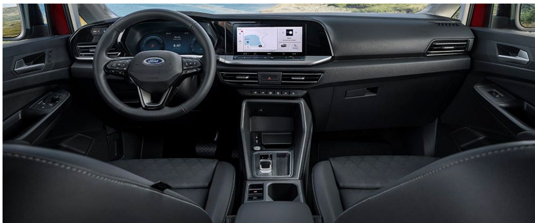
Slika prikazuje notranjost nivoja opreme Active z opcijskim Avdio sistemom 6