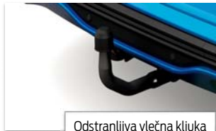
Odstranljiva vlečna kljuka