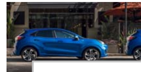
Aktivna pomoč pri parkiranju