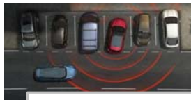
Prepoznavanje prečnega prometa