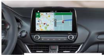
Navigacijski sistem Ford SYNC 3