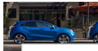
Aktivna pomoč pri parkiranju