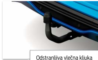
Odstranljiva vlečna kljuka