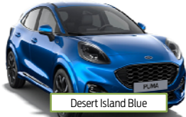
Desert Island Blue