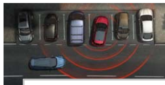
Prepoznavanje prečnega prometa