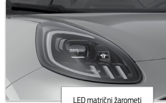
LED matrični žarometi