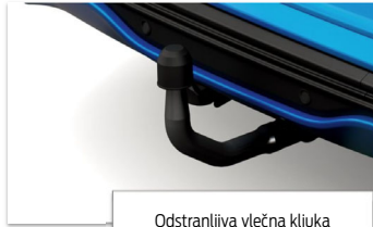
Odstranljiva vlečna kljuka